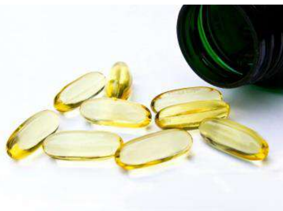
Los suplementos pueden ayudar a estimular su libido muy rápidamente

Usar suplementos para el deseo sexual natural es como tomar más de los alimentos adecuados para que su cuerpo se abastezca con niveles adecuados de los minerales y vitaminas que necesita para funcionar de manera óptima.