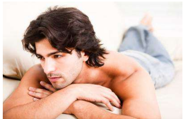
Las causas de la impotencia son mayormente físicas pero algunas veces son sicológicas

Para algunos hombres, las causas de la disfunción eréctil son enteramente sicológicas y con todo son viables de ser tratadas usando métodos mentales y físicos.