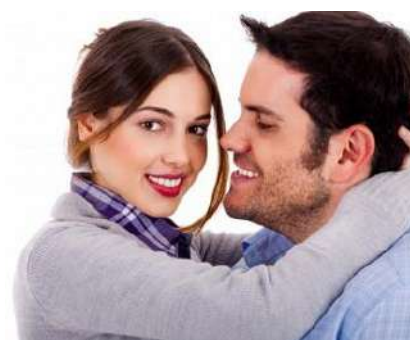
Tener una libido alta es importante

Esta guía está diseñada para aumentar su libido tan naturalmente y permanentemente como sea posible. Después de haber experimentado una libido baja yo mismo, visité a innumerables doctores y expertos médicos sin encontrar una solución, comencé a investigar el tema ampliamente. He descubierto que estos métodos funcionan mejor y pueden ser muy eficaces para lograr resultados permanentes. Mis recomendaciones son respaldadas por investigaciones sólidas y estudios oficiales.